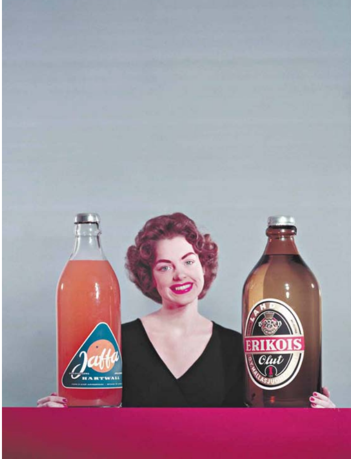
Hartwallin Jaffa tuli myyntiin vuonna 1949.