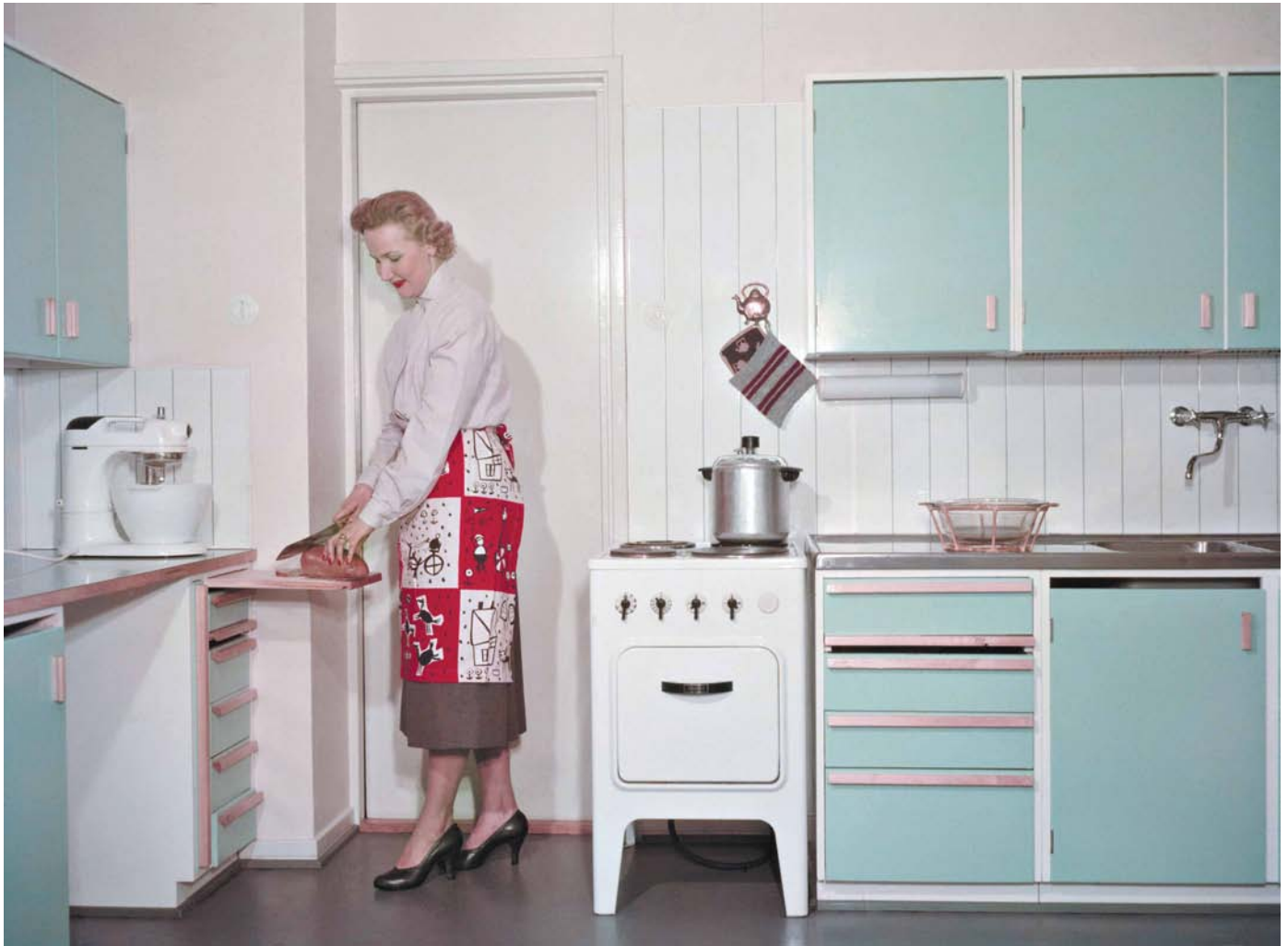
Arava-järjestelmä muutti kaupunkikeittiöitä vuonna 1949. Uusien keittiöihin kuuluivat mm. tiskiallas, sähkö- tai kaasuhella ja juokseva vesi. Kodin yleiskone oli luonteva jatko muutoksille.