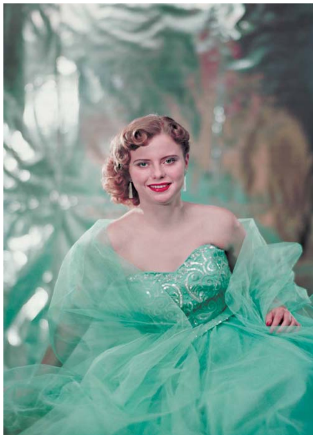
Sodanjälkeisen henkisen ja taloudellisen ahdingon hellittäessä lehtien kansissa tavoiteltiin ylellisyyden tuntua. Claire Aho kuvasi 1950-luvulla Eeva-lehdelle glamour-henkisiä kansikuvia.